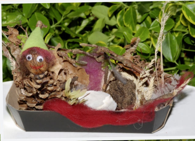
Wichtelgärten laden zum Träumen und Spielen ein ...

Bereich: Spielen & soziales Lernen • Ab 3 Jahren • Arbeitszeit: ca. 3 x 20 Minuten